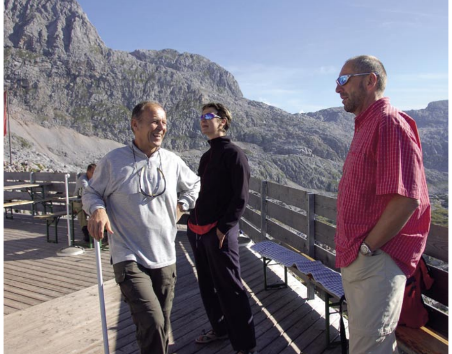
Die Bergfreunde wurden mit Kaiserwetter belohnt.